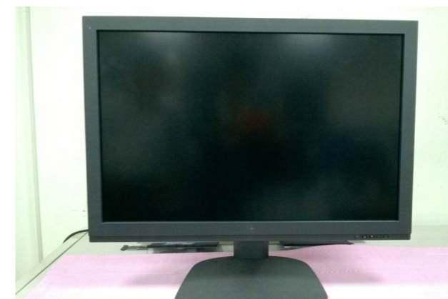
圖 2. 產品示意圖

透過自行開發的 ICC 色彩校正演算法建立 3D LUT，模擬多種色彩空間，色彩校正符合 97% sRGB、99% Adobe-RGB、97% ECI-RGB、 \pm 7\% DICOM、Whitepoint \Delta E \leq 1.0 。只需要利用顯示器內建的 Front Sensor 或外掛式 Sensor 透過 USB 直接連接顯示器，即可自動色彩校正，並且可將校正後資料儲存於顯示器中，不因更換 PC 受影響，具可攜性。